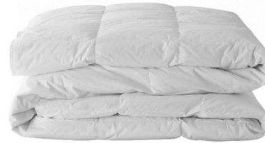
Piumone letto matrimoniale Nr. 1 e letto singolo Nr. 3 Nr. 1 comforter for double bed and Nr. 3 comforter for single bed