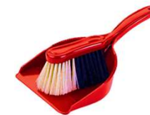
Paletta + spazzola Nr. 1 Dustpan and brush

Verificate che l'inventario in dotazione sia completo. Il giorno della partenza, dopo un controllo di un nostro incaricato, vi verrà addebitato l'importo degli oggetti mancanti, qualora la reception non ne fosse stata informata all'arrivo.