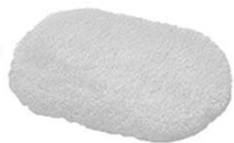
Straccio per pavimenti Nr. 1 Floor cloth