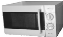
Microonde Nr. 1 Microwave