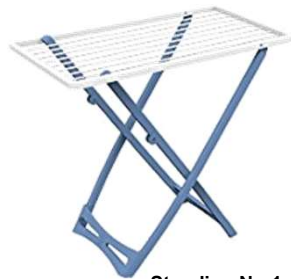
Stendino Nr. 1 Drying rack