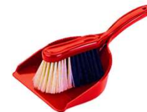
Paletta + spazzola Nr. 1 Dustpan and brush

Verificate che l'inventario in dotazione sia completo. Il giorno della partenza, dopo un controllo di un nostro incaricato, vi verrà addebitato l'importo degli oggetti mancanti, qualora la reception non ne fosse stata informata all'arrivo.