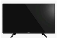
TV Nr. 1