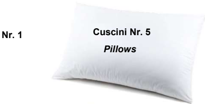
Cuscini Nr. 5 Pillows