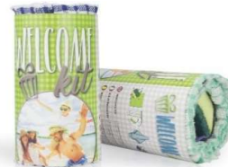
Welcome Kit Nr 1 Welcome kit