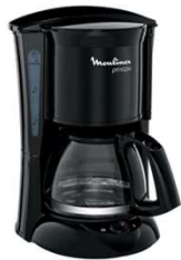
Macchina caffè Nr. 1 American coffee maker