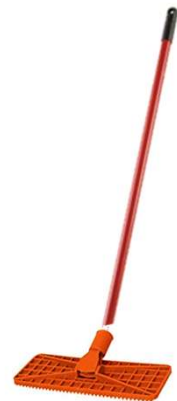
Spazzolone Nr. 1 Floor scrubbing brush