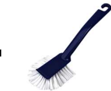
Spazzola per piatti Nr. 1 Dish brush